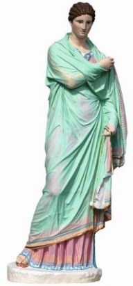
© Liebieghaus Skulpturensammlung, Frankfurt am Main