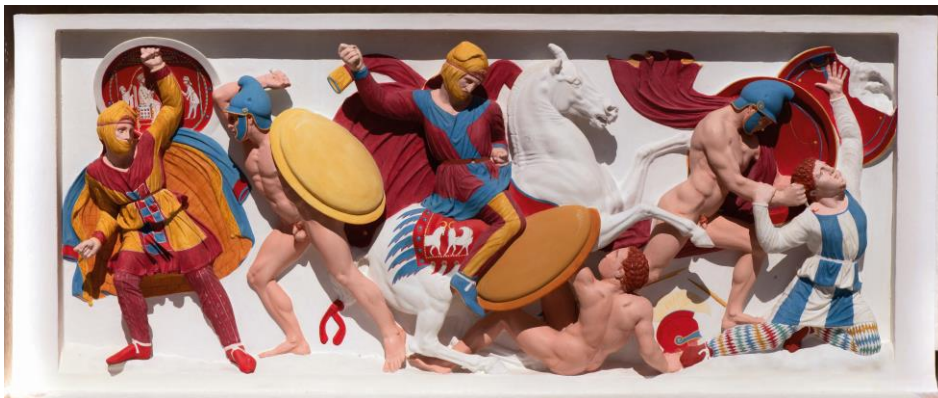
© Liebieghaus Skulpturensammlung, Frankfurt am Main

Liebieghaus Skulpturensammlung, Frankfurt am Main